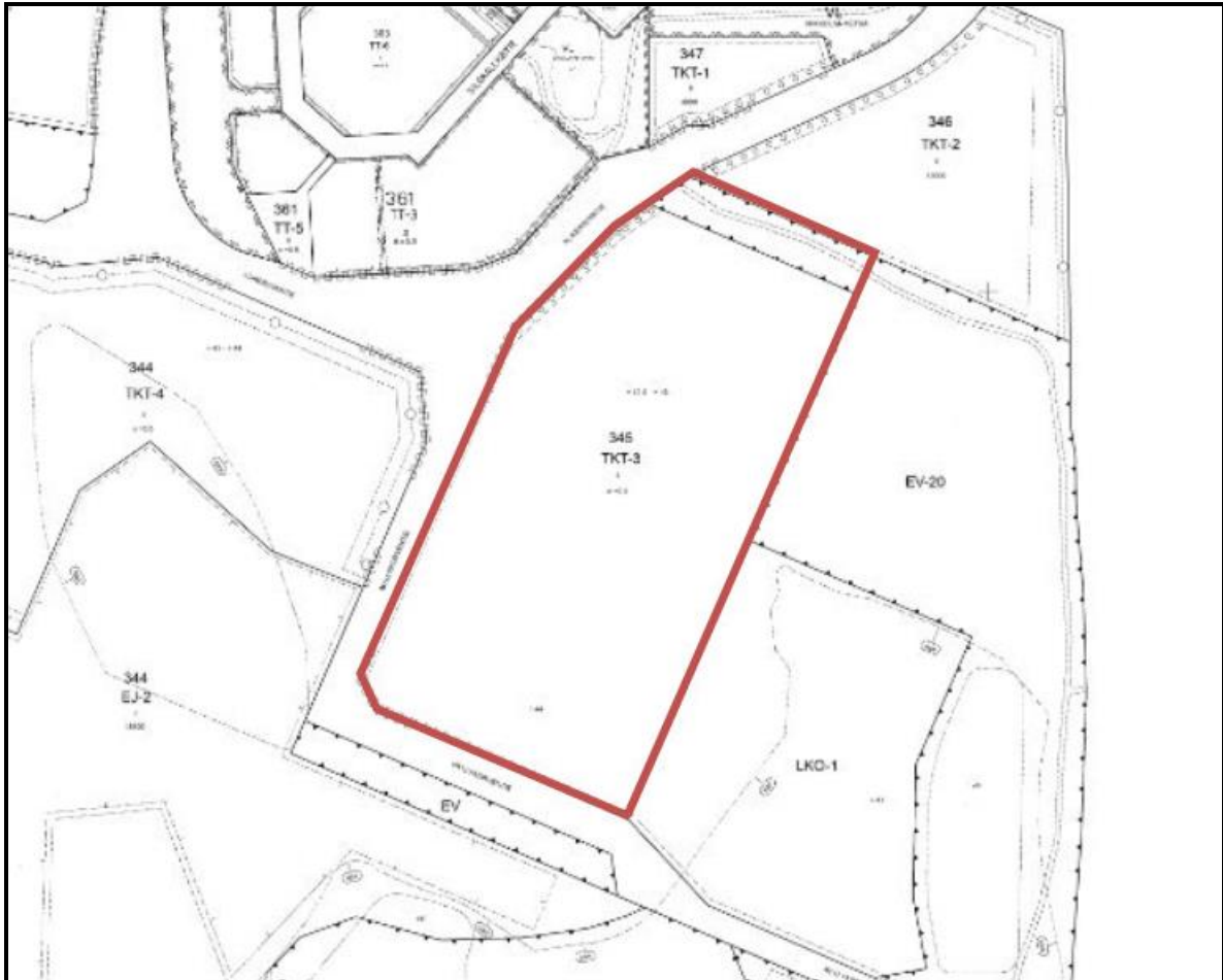
Ote ajantasakaavasta. Suunnittelualueen alustava rajaus punaisella.

Voimassa olevaan asemakaavaan suunnittelualue on merkitty teollisuus-, varasto- ja toimistorakennusten korttelialueeksi (TKT-3) ja suojaviheralueeksi (EV-20). Suojaviheralueen läpi kulkee ohjeellinen jalankulkureitti.