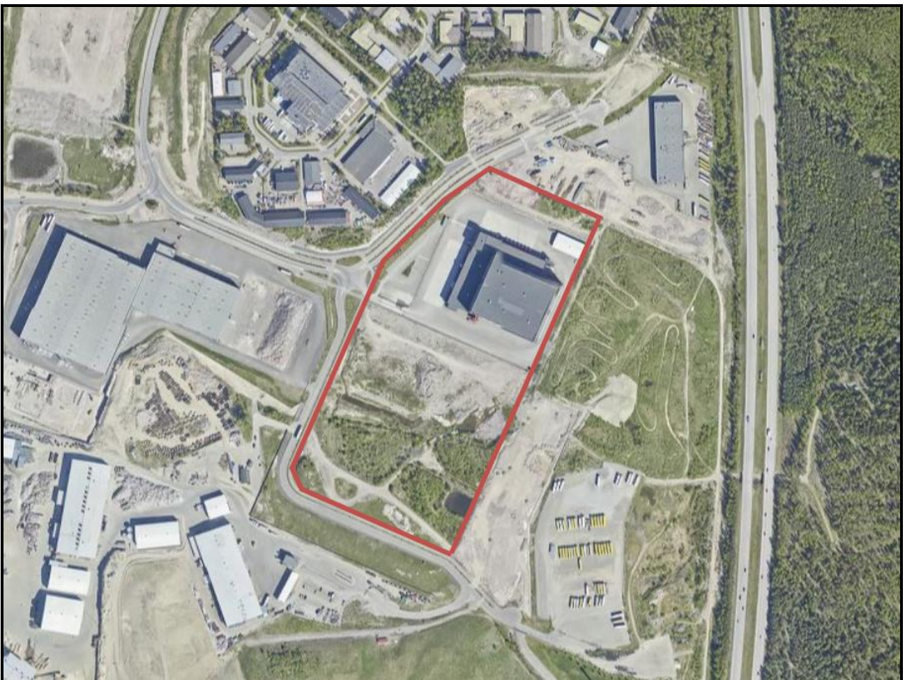
Suunnittelualueen alustava rajaus ilmakuvasa.

Suunnittelualue sijaitsee Kercan yritysalueella, linnuntietä noin 3,1 kilometrin etäisyydellä Keravan keskustasta etelään. Se käsittää osoitteessa Alikervantie 77 sijaitsevan logistiikkakäytössä olevan kiinteistön sekä sen pohjoispuolisen suojaviheralueen osan. Suojaviheralueen osalla kulkee huomattava määrä kaupunkitekniikan putkia ja johtoja.