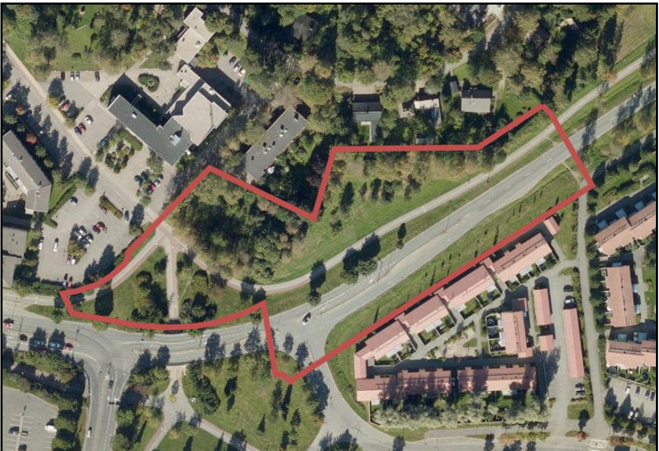
Suunnittelualueen alustava rajausta ilmakuvassa.

Suunnittelualue sijaitsee linnuntietä noin 750 metrin etäisyydellä Keravan keskustasta itään. Se käsittää osoitteessa Jussilantie 1 sijaitsevan rakentamattoman kiinteistön ja sen lähellä sijaitsevat kevyen liikenteen väylät sekä niiden väliset puistoalueet. Etäisyys Keravan asemalle on noin 600 metriä. Tärkeimmät kaupalliset palvelut sijaitsevat Keravan keskustassa ja suunnittelualueen välittömässä läheisyydessä, ja koululle on matkaa noin 350 metriä. Muutosalueen pinta-ala on noin 1,5 hehtaaria.