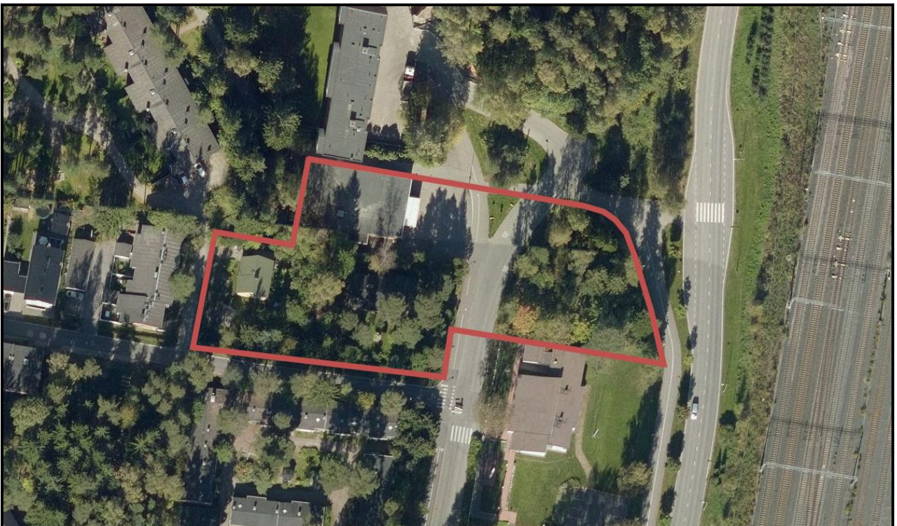
Suunnittelualueen alustava rajausta ilmakuvassa.

Suunnittelualue käsittää osoitteessa Käenkatu 2 sijaitsevan liikerakennuksen, Väinämöisentien ja Terhikintien varrella sijaitsevat omakotitalot, yleisen pysäköintialueen sekä osan Väinämöisentien katualueesta. Keravan rautatieasema ja keskustan kattavat palvelut ovat noin 800 metrin etäisyydellä suunnittelualueesta.