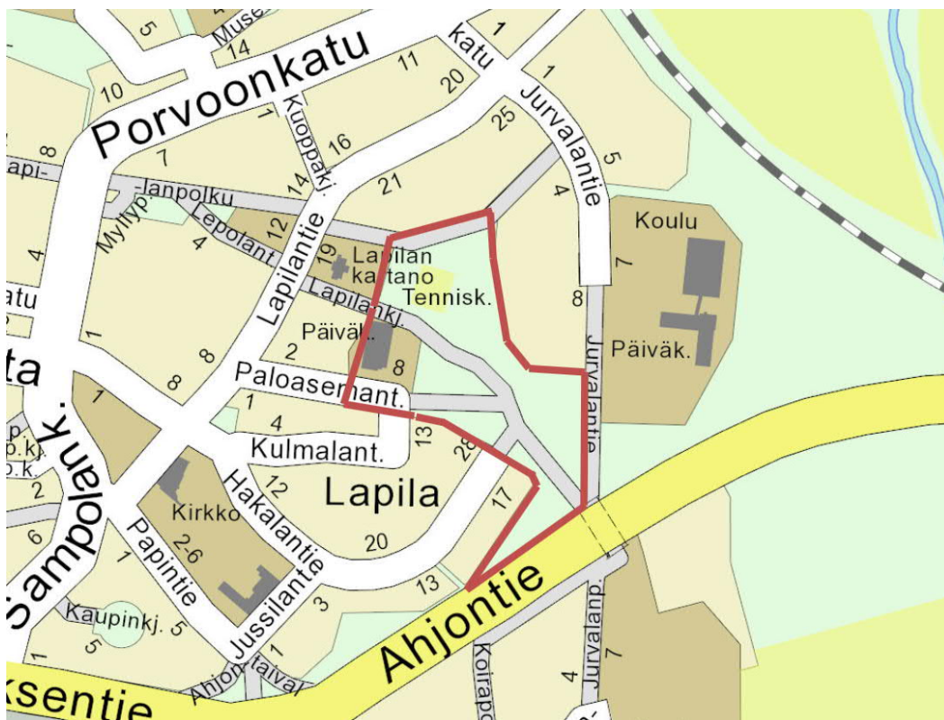
Suunnittelualueen likimääräinen raja- ja opaskartalla.

Asemakaavan muutos koskee 4. Keskustan kaupunginosan korttelin 8 osaa sekä katu- ja virkistysalueita.