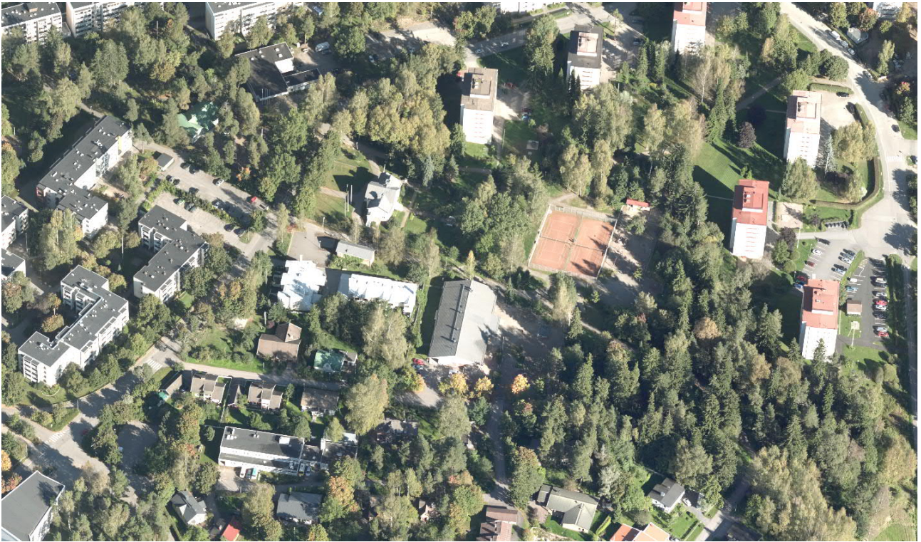
Viistoilmakuva suunnittelualueen kohdalta