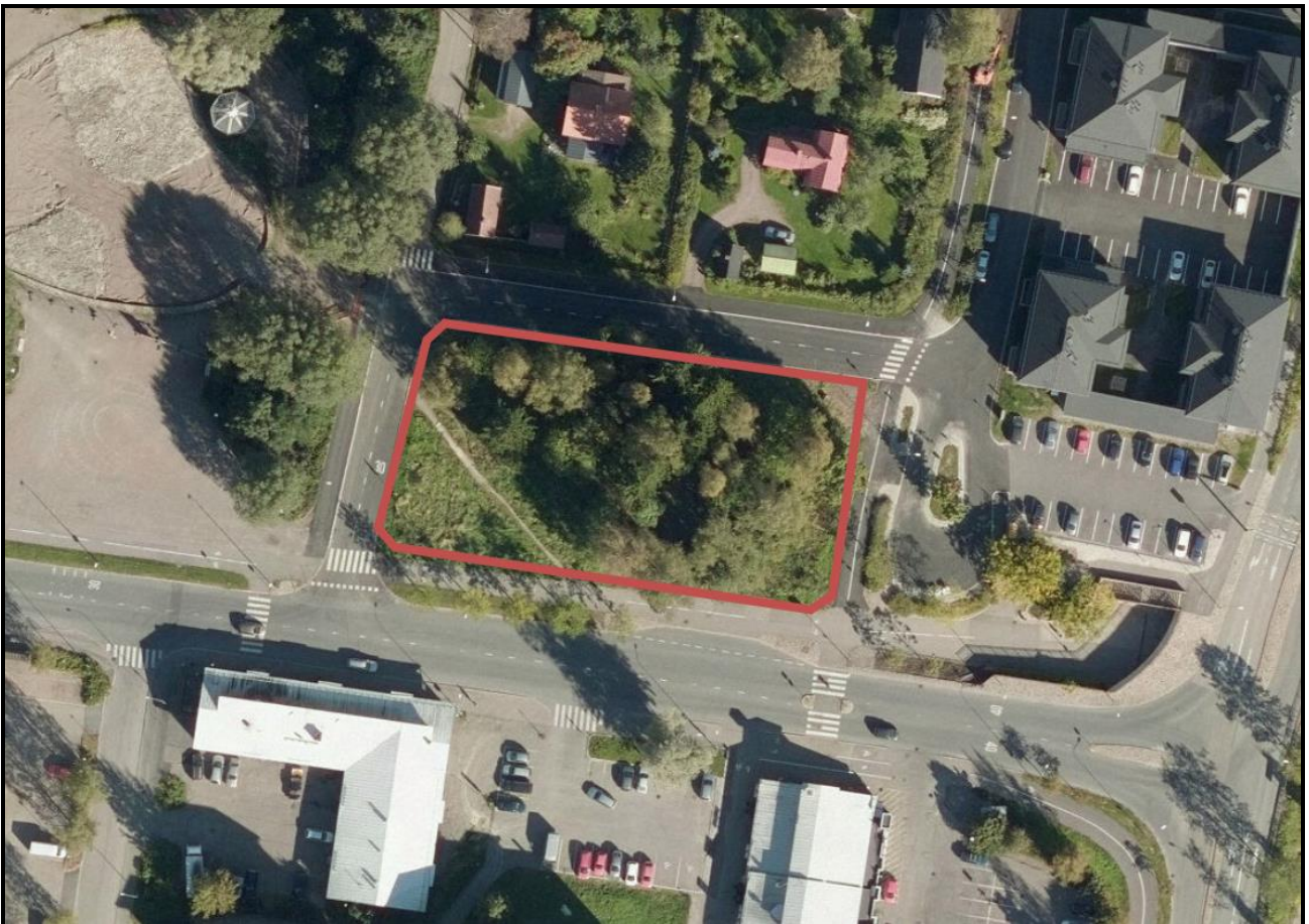
Suunnittelualueen alustava rajaus ilmakuvassa.

Suunnittelualue sijaitsee noin 2,5 kilometrin etäisyydellä Keravan keskustasta etelään, ja se käsittää osoitteessa Koivikontie 3-5 sijaitsevan rakentamattoman kiinteistön. Etäisyys Savion rautatieseisakkeelle on noin 100 metriä. Savion kaupalliset palvelut ja lähivirkistysalueet sijaitsevat Koivikontien varrella ja suunnittelualueen välittömässä läheisyydessä. Muutosalueen pinta-ala on noin 2495 m 2 .