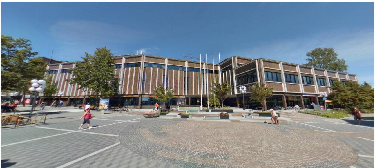
Liiketalo Puuvalonaukiolta kuvattuna.

Suunnittelualueelle kohdistuu lentomelua.