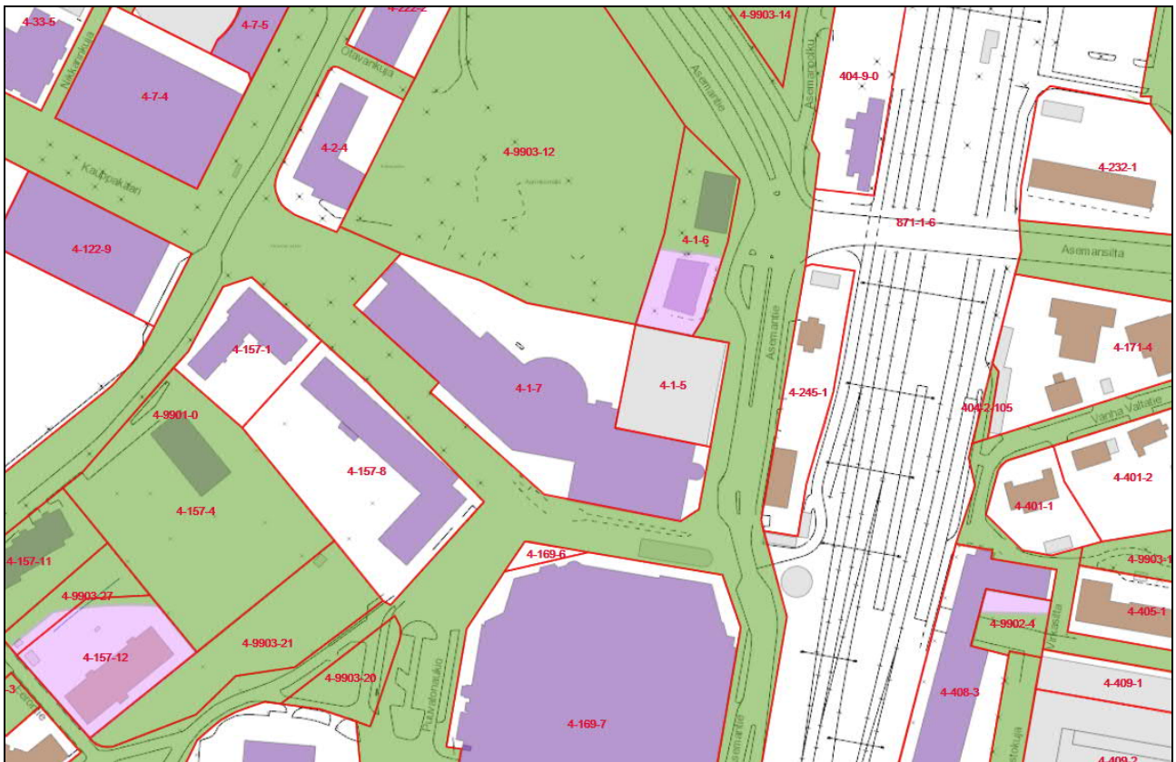
Kuva kaupungin maanomistuksesta. Kaupunki omistaa viiheellä sävytetyt alueet.

Suunnittelualue on suurelta osin kaupungin omistuksessa. Yksityisten maanomistajien kanssa laaditaan tarvittaessa maankäytösopimukset.